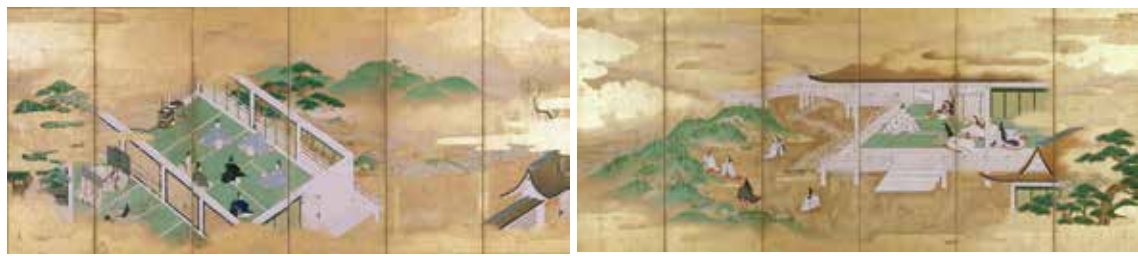
重要文化財《萬の細道図屏風》(右隻) 後醍醐天皇 鳥丸光広筆 (つたのほそみちずびょうぶ たわらやそうたつひつ 六曲一双 紙本金地著色 江戸時代 17世紀 相国寺蔵 ※11期)

仁親王の菩提所として塔頭の慈照院には宮家ゆかりの寺宝が多く伝来しています。本展覧では、江戸時代に描かれた伊勢・源氏の屏風絵とともに江戸時代の公家の和歌や絵画を紹介し、江戸時代、京で復興した王朝文化の世界を堪能してください。 【名称】 王朝文化への憧れ—雅の系譜 【会期】 3月20日(日)～5月15日(日) 【1期】 3月20日(日)～5月15日(日) 【2期】 5月22日(日)～7月18日(月祝) 【開催時間】 10時～17時(入館は16時30分まで) 【拝観料】 一般800円 【65歳以上・大学生】600円 【中学生】300円 【小学生】200円 ※一般の方に限り、20名様以上は団体割引で各700円 【会場】 相国寺承天閣美術館 (京都市上京区今出川通烏丸東入ル) 【お問い合わせ先】 相国寺承天閣美術館 ☎075-2441-0423 【公式HP】 http://www.shokoku-ji.jp/