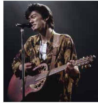
1991年名古屋国際会議場センチュリーホール