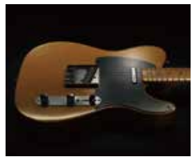
Fender Telecaster Yellow

本紙で紹介した展覧会の入場券をペア2組に差し上げます。【応募あて先】ハガキに郵便番号・住所・氏名・年齢・電話番号を明記の上 年545-0023 大阪市阿倍野区王子町4-3-31 アベノタウン「尾崎豊展」係