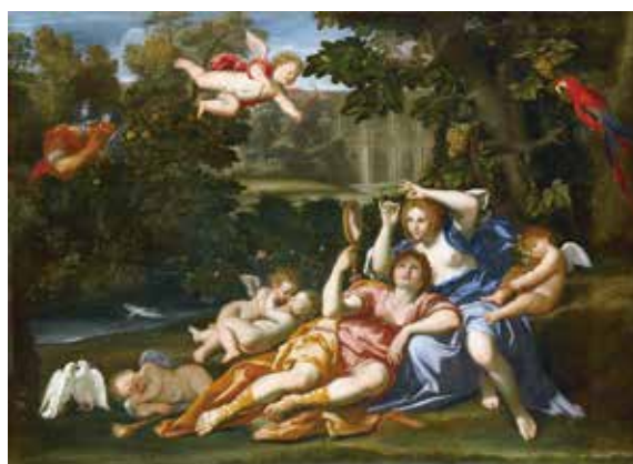
ドメニキーノ(本名ドメニコ・ザンビエーリ)「リナルドとアルミータ」1617-1621年頃 / パリ、ルーヴル美術館蔵

人間の根源的な感情である愛は、古代以来、西洋美術の根幹をなすテーマの一つであったといえるでしょう。ギリシア・ローマ神話を題材とする神話画、現実の人間の日常生活を描く風俗画には、特別な誰かに恋焦がれる神々、人々の情熱や欲望、官能的な悦び、あるいは苦悩や悲しみが様々なタッチで描かれていま。一方、宗教画においては、神が人間に注ぐ無償の愛を、人間が神に寄せる愛が、聖家族、キリストの磔刑、聖人の殉教といった主題を介して、信者に示されていきます。