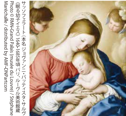
サンテラート(本名ジャン・バティスト・サントラート)「聖母子」1685年頃、ルーヴル美術館蔵

本紙で紹介した展覧会の入場券をペア2組に差し上げます。 【応募あて先】 ハガキに郵便番号・住所・氏名・年齢・電話番号を明記の上 〒545-0023 大阪市阿倍野区王子町4-3-31 平野タウン7月号「ルーヴル美術館展」係 までご応募ください。 ■締切:7月4日必着 ※当選者の発表は発送をもってかえさせていただきます。