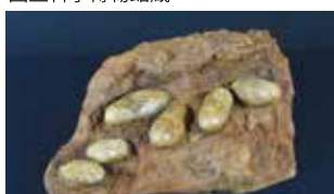
恐竜の卵 群馬県立自然史博物館蔵

進化を示す「アウ ト・オブ・チベツト」 説を、世界初公開 となる「チベツトケ サイ」の全身骨格復 元標本と生体復元 モデルの展示とと もに解説します。