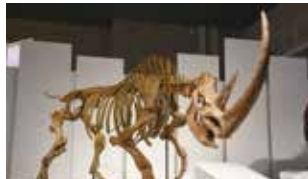
チベツトケサイ 全身骨格復元標本 国立科学博物館蔵

本紙で紹介した展覧会の入場券をペア5組に差し上げます。 【応募あて先】 ハガキに郵便番号・住所・氏名・年齢・電話番号を明記の上 〒545-0023 大阪市阿倍野区王子町4-3-31 平野タウン7月号「化石ハンター展」係 までご応募ください。 ■締切:7月4日必着 ※当選者の発表は発送をもってかえさせていただきます。