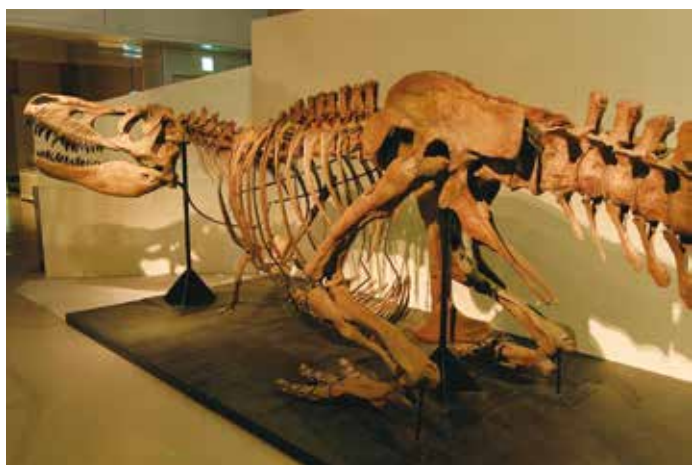
タルボサウルス 全身骨格 国立科学博物館

化石ハンターは、探究心に富み、抜群の行動力や貴重な化石を発掘・研究する挑戦者です。本展覧会の主役は、ロイ・チャップマン・アンドリュースを はじめとする化石ハンターです。1900年代から2000年代の100年の間に、彼ら化石ハンターが、中央アジアで発見した研究成果について、数多くの恐竜や哺乳類などの標本を含めた貴重な資料を交えながら紹介いたします。 また、氷河時代の大型哺乳類の放散、